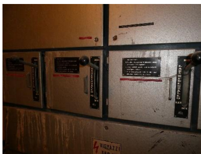
5. kép: A lépcsőházankénti tűzeseti főkapcsolók