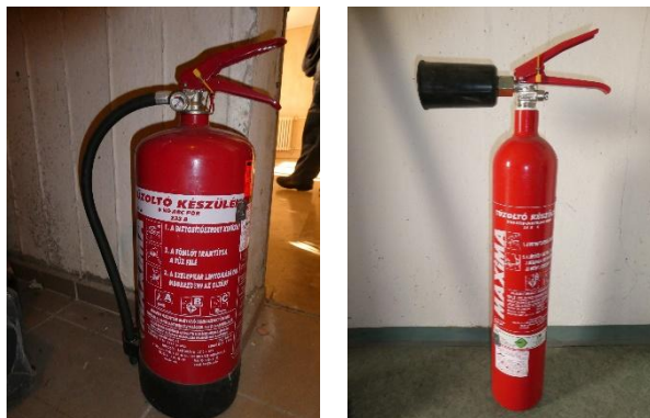
3. kép: Hordozható tűzoltó készülékek különböző típusai