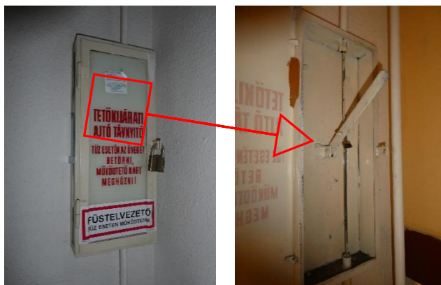
2. kép: Hő- és füstelvezetést, menekülést biztosító távnyitó